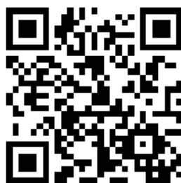
HMS-kort i bygge- og anleggsnæringen