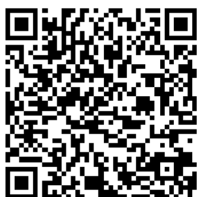
Krav til arbeid på og ved vei

For ytterligere informasjon: www.rvofond.no